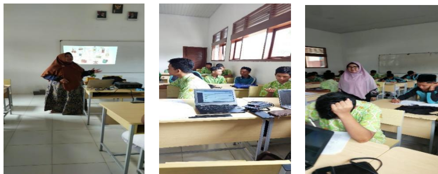
Gambar 2: Pelaksanaan Penyuluhan tentang Bahaya Merokok Bagi Kesehatan di SMP Negeri 1 Darul Imarah Kabupaten Aceh Besar