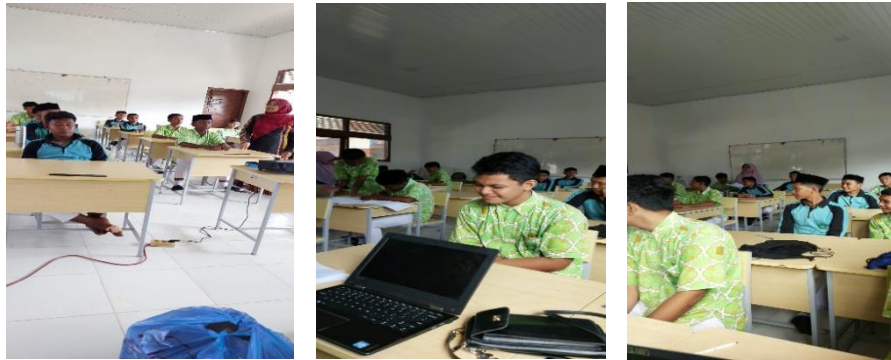
Gambar 3: Pelaksanaan Evaluasi (pretest dan Postest) menggunakan kuesioner di SMP Negeri 1 Darul Imarah Kabupaten Aceh Besar